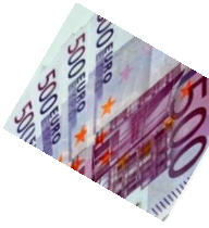
Tabla 3. Retribuciones comparadas de Carles Puigdemont respecto a algunos líderes internacionales

Carles Puigdemont cobrará este 2016 más que los jefes de gobierno de España, Italia o Rusia, es decir, Mariano Rajoy , Matteo Renzi y Vladimir Putin .