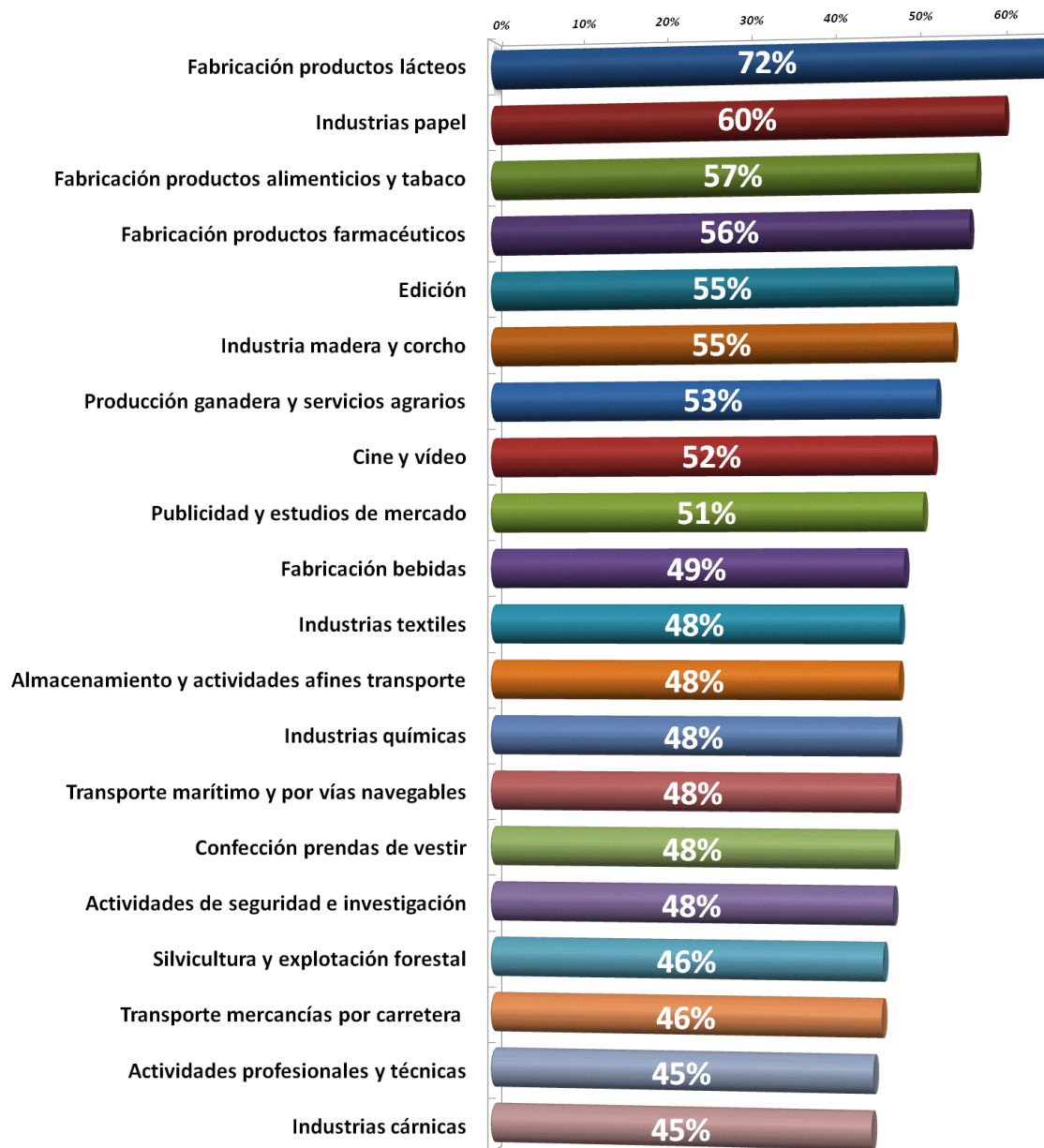
Gráfico 4. Porcentaje de producción asociada al resto de España para las 20 ramas de actividad de la economía catalana más dependientes del resto del país