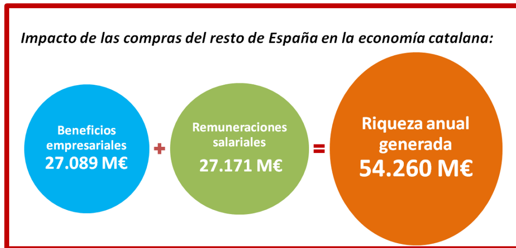
Gráfico 3. Infografía resumen 3