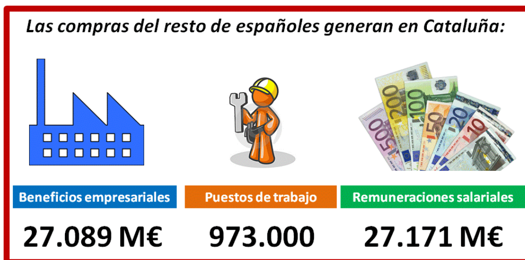
Gráfico 1. Infografía resumen 1

En el caso hipotético, por ejemplo, de que las ventas de las empresas catalanas al resto de España cayeran al nivel de un país extranjero como Francia , ello significaría una importante pérdida para la economía catalana que el modelo matemático utilizado permite cuantificar. Por una parte, las empresas catalanas perderían 20.900 millones de euros en beneficios empresariales derivado de la notable caída de ventas al resto de España y, por otra parte, afectaría negativamente también al empleo, con una pérdida de remuneraciones salariales de otros 20.800 millones de euros . Se trataría, en consecuencia, de efectos de gran calado para la economía catalana.